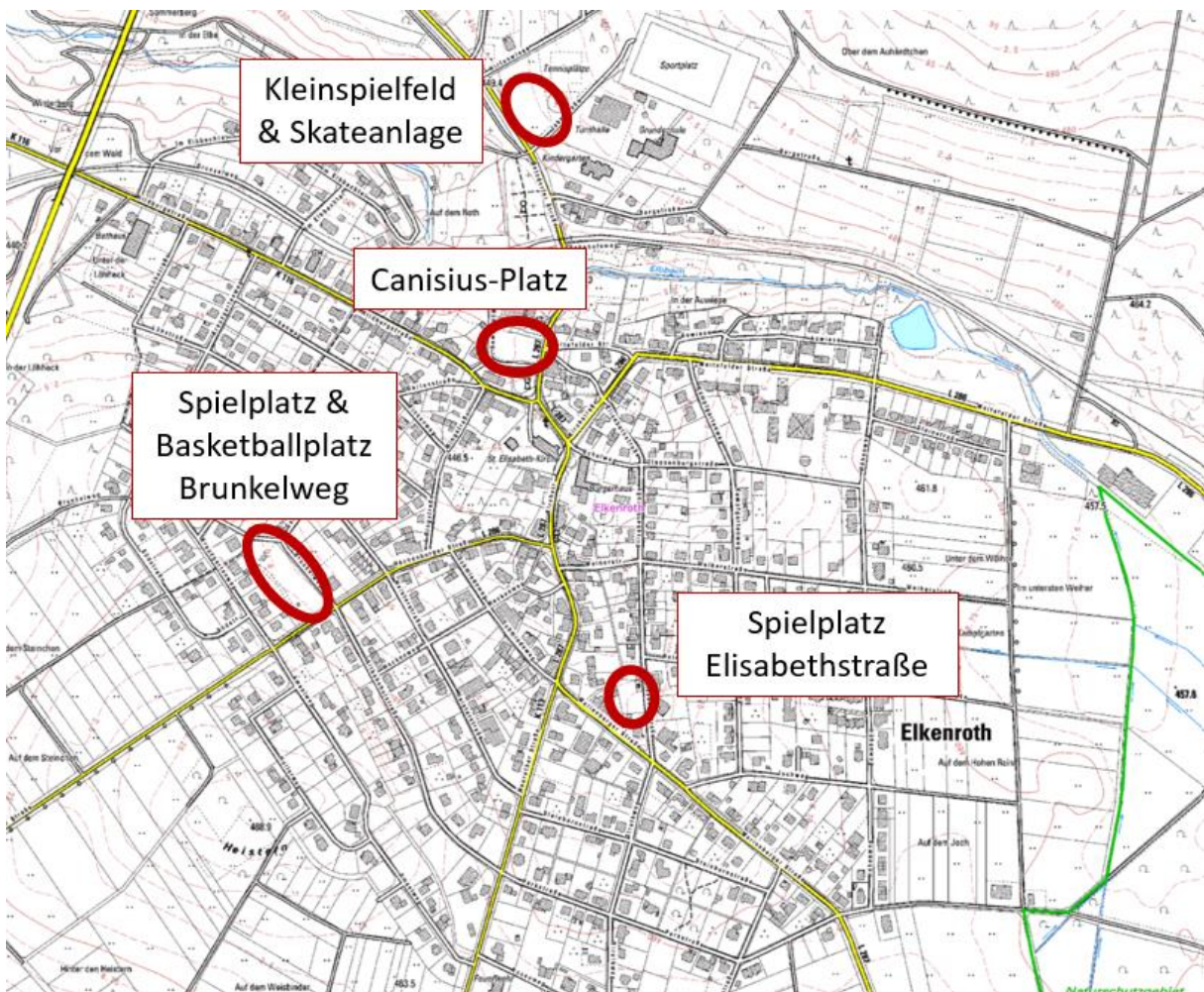
Abbildung 10: Verortung der Freizeitanlagen in Elkenroth (Kartengrundlage aus LANIS RLP)