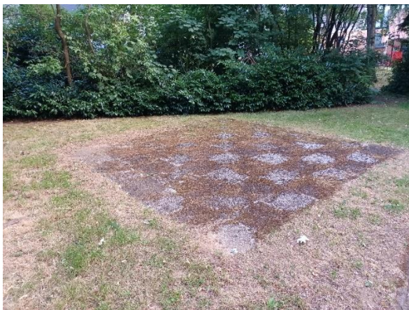
Abbildung 7: Nicht mehr genutztes Schachfeld