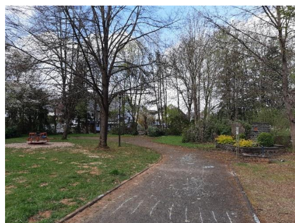
Abbildung 2: Blick in die Parkanlage