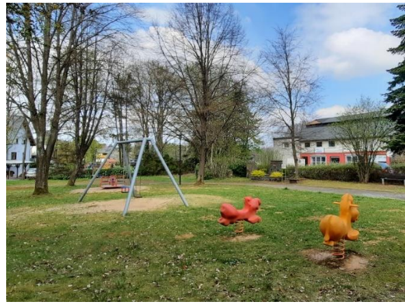
Abbildung 4: Zwei Wipptiere, Doppelschaukel mit Kleinkindersitz, Karussell