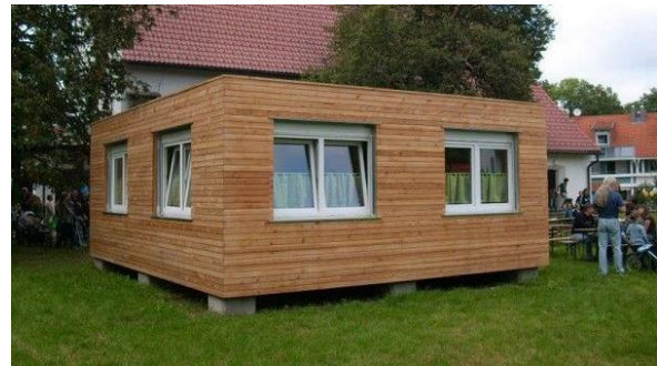
Abbildung 14: Beispiel Container-Jugendraum