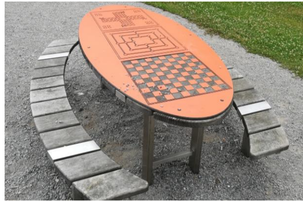
Abbildung 12: Spiel-Picknick-Kombination