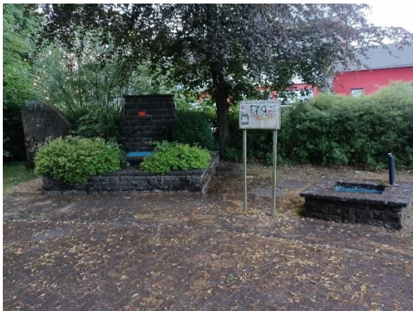
Abbildung 5: Brunnenanlage und Infotafel