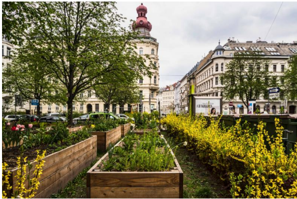
Abbildung 11: Beispiel Hochbeete

Danach stellte sie anhand von Beispielfotos mögliche Gestaltungselemente vor (siehe folgende Abbildungen).