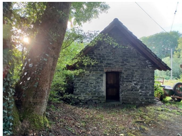
Abbildung 8: Backes