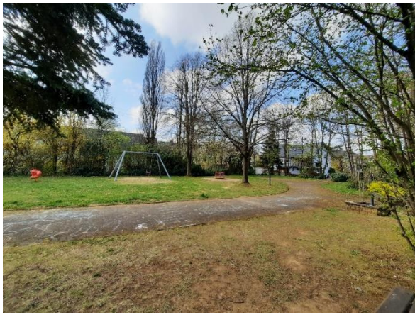
Abbildung 3: Spielgeräte und gepflasterter Weg