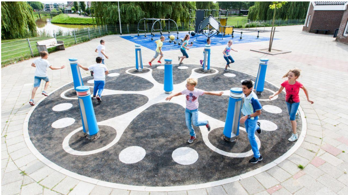
Abbildung 15: Lappset Memo Spielsäulen