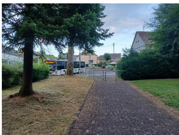
Abbildung 1: Blick auf die Betzdorfer Straße