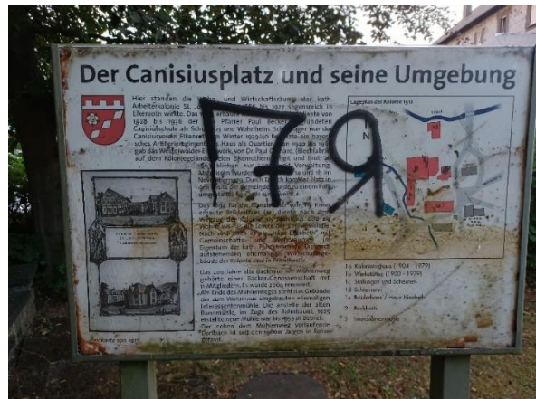
Abbildung 6: Infotafel