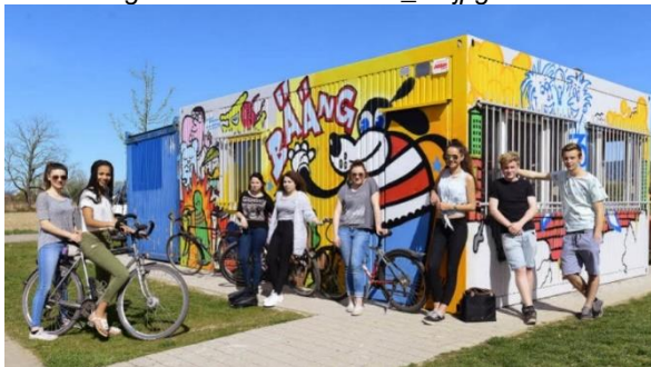
Abbildung 13: Beispiel Container-Jugendraum