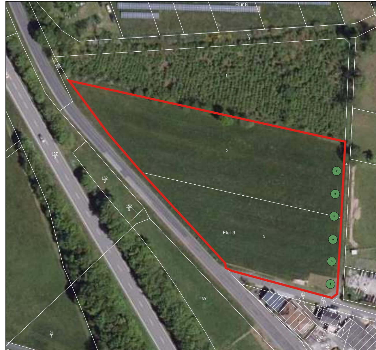
Gemarkung Kausen, Flur 9, Flurstücke 2 und 3

Entwicklung artenreicher Wiesen (Feuchtwiese/ magere Flachland-Mähwiese) und artenreicher Seggenriede auf derzeitiger Rinderweide in der Talau durch dauerhafte biotopgemäße extensive Pflege unter Berücksichtigung der Habitatsprüche des Wiesenknopf-Ameisenbläulings, Bekämpfung einer Neophytenflur, Durchführung eines Monitorings