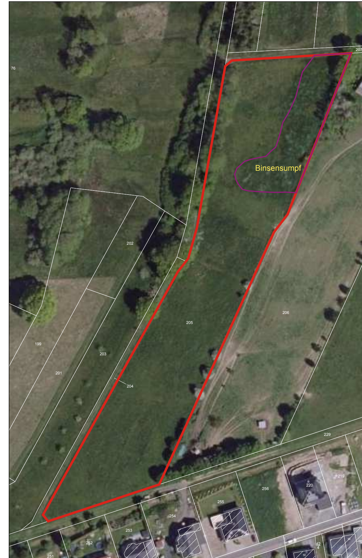
Gemarkung Kausen, Flur 5, Flurstück 205