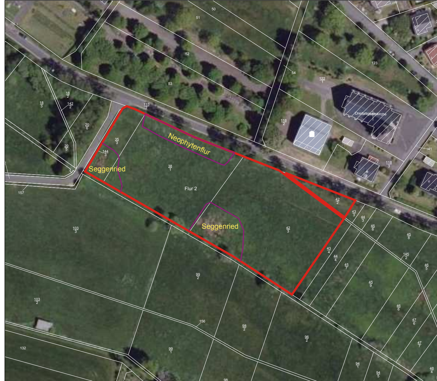
Gemarkung Kausen, Flur 2, Flurstücke 35/3, 38/1, 42/2, 42/3